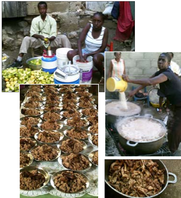
Das Festtagsmenu: Reis mit schwarzen Bohnen und frittierten Poulets.

Die Eltern helfen bei der Zubereitung des Festessens mit und werden so aktiv miteinbezogen.